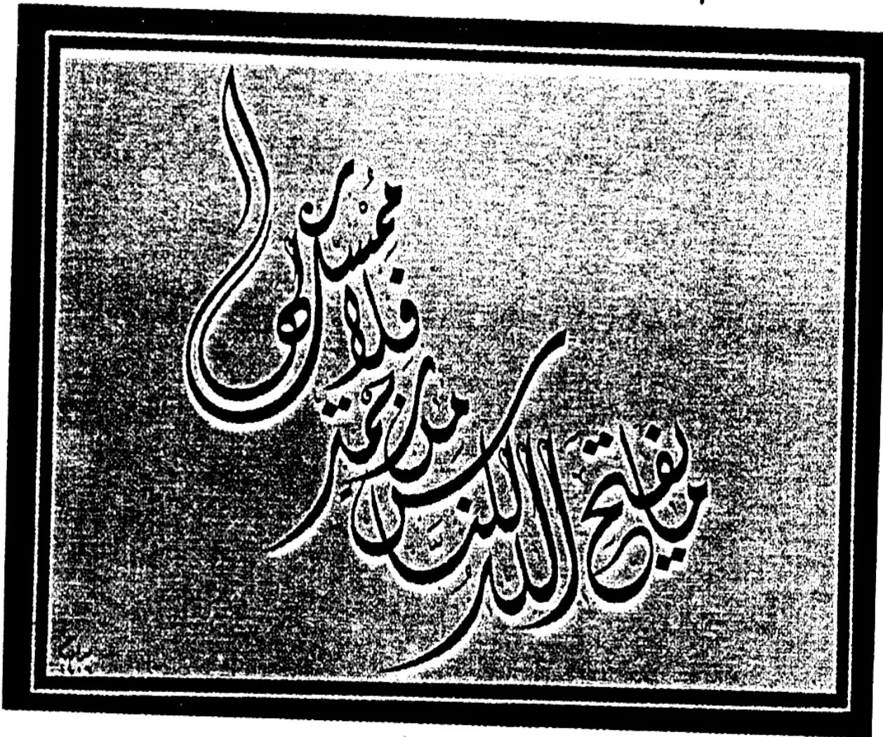
نموذج من الخط الديواني الجلي .