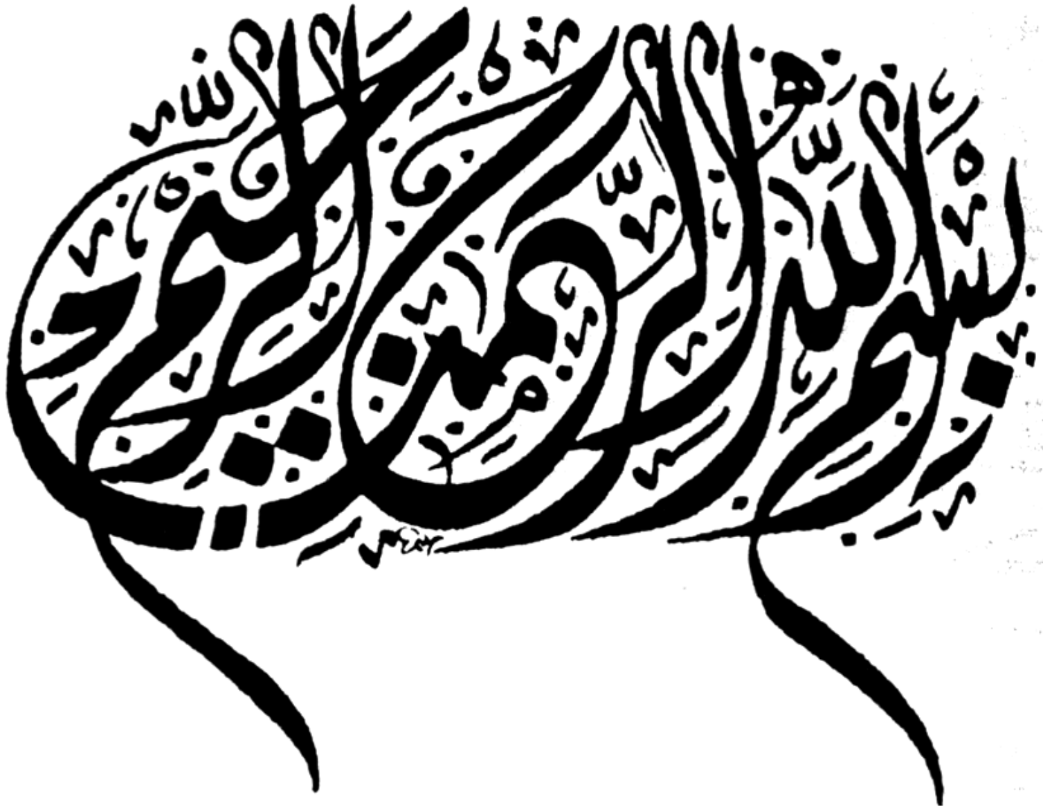
نموذج من الخط الديواني الجلي للخطاط حليم.